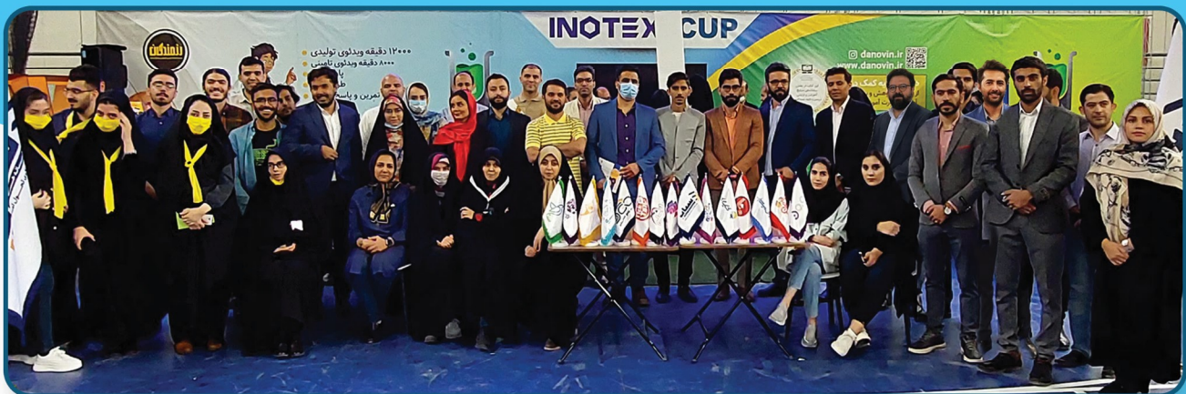
حضور خط و قلم در بزرگترین نمایشگاه فناوری کشور (اینو تکس) در کنار سایر استارتآپ های آموزشی